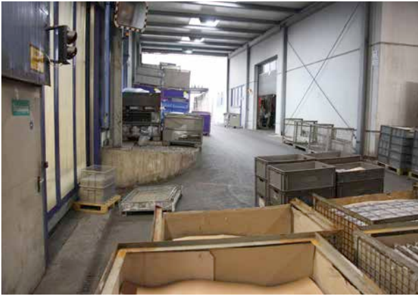
Bild 2: So sah es früher aus: Platznot überall, wo man sich bewegen wollte.