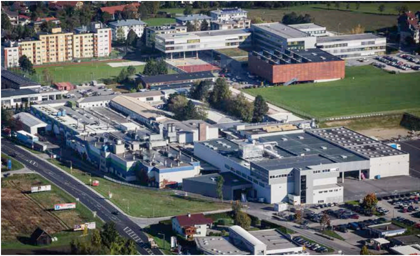
Bild 4: Luftbild des TCG Unitech Werkes in Kirchdorf an der Krems.

gebäude. Die Schmelzerei wird noch verlagert und durch Umstellungen in der mechanischen Bearbeitung wird Platz für dringend benötigte Maschinen geschaffen. Schon in der Konzeption war klar, dass der Versuch, alles in das Stammwerk zu pressen, zum Scheitern verurteilt war. Daher entstand zusätzlich ein neuer Standort speziell für die Bearbeitung von Produkten für BMW. Auf einer hochgradig